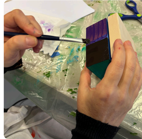
3 • Peignez chaque zone à la peinture acrylique