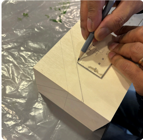
1 • Dessinez votre design